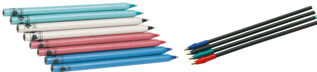
Exemple de stylos rechargeables à gauche et leurs recharges à droite