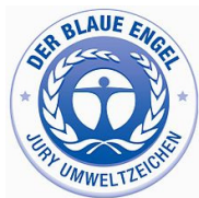
L'écolabel allemand Der Blaue Engel (L'Ange bleu)

En France, après l'écolabel européen et NF Environnement, on trouve en majorité les 2 labels ci-dessous, sur les produits papier (cahiers, ramettes de papier, etc.).