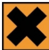
Xi – Irritant