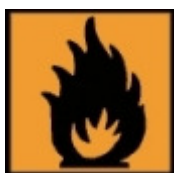
F – Facilement inflammable

Préférez les produits ne contenant pas de substances toxiques. Les solvants toxiques les plus répandus sont le xylène et le toluène. On le retrouve dans certaines colles, surligneurs, marqueurs, feutres effaçables pour tableau blanc, et correcteurs. Vérifiez bien sur l'emballage que le produit porte une indication du type « ne contient ni xylène ni toluène ». Les produits avec des colorants (feutres, crayon de coloriage, etc.) peuvent contenir des métaux lourds (plomb, mercure, cadmium, chrome). Il en existe « sans métaux lourds ». Les gommes peuvent contenir du PVC (polychlorure de vinyle). Préférez les gommes sans PVC, et dans l'idéal en caoutchouc naturel (provient d'un arbre tropical, l'hévéa). D'une manière générale, évitez aussi les produits qui affichent des pictogrammes de danger (ex : stylos correcteurs « blanco »)